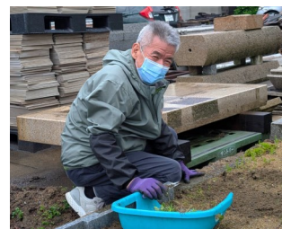
柿の木の下で草むしりをしていて社長に、「毎日追い回してすみません～」と言ってシャッターを押した写真です。笹山