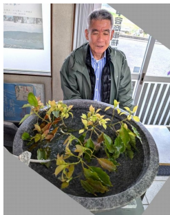
ポニョたちの様子を向う、優しさ全開の社長の笑顔

当社が会社の「環境整備憲章」を作った環境整備に取り組んでもう二十年以上になります。