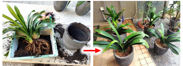
お仕事をさせていただく中で、心豊かに暮らしていらっしゃるお客様から教えていただくことがたくさんあります。