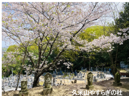
久米山やすらぎの杜

私たちの仕事も、庭の草木が動き出し、お墓参りの足も繁くなるにつれ、ご相談が増えてまいります。これから忙しい季節を迎えますが、一つひとつ丁寧な仕事を積み重ねてまいります。