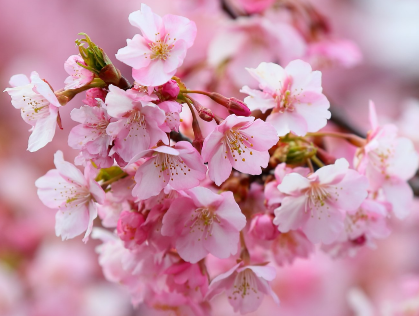
今年の桜 大川工場 奥野 武