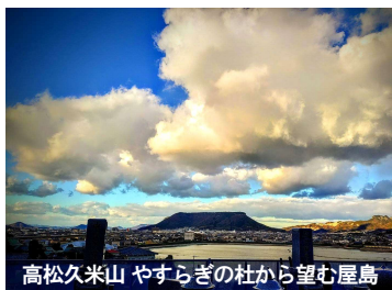
高松久米山 やすらぎの社から望む屋島