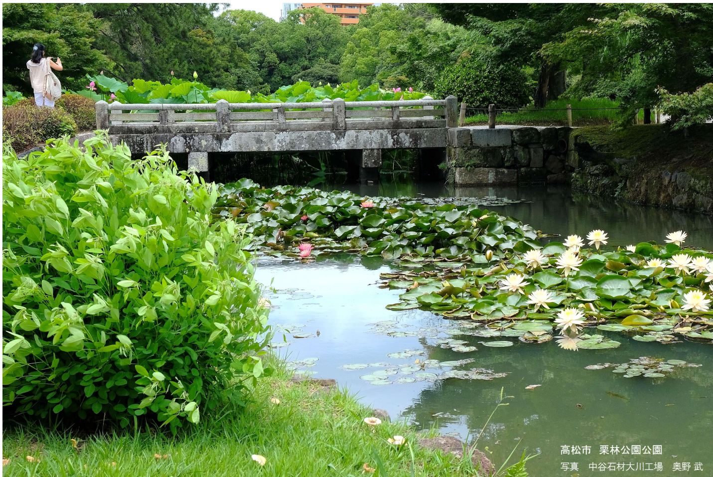
高松市 栗林公園公園 写真 中谷石材大川工場 奥野 武

創業以来100余年、幸せな明日へ祈りの心を… NS 中谷石材株式会社 〒761-0121 高松市牟礼町牟礼3766-1 電話 087-845-5006