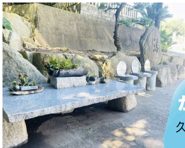
久米山社務所前のベンチです。

8/10.11 かき氷をどうぞ 久米山霊園・管理事務所 9:00~15:00 各日100杯限定 ※無くなり次第終了