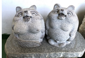
配送センターでみんなを見守っています