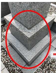
汚れていた箇所がスッキリ！