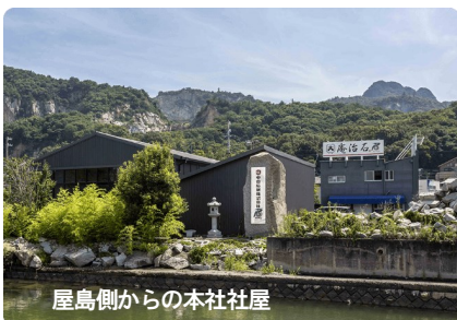
屋島側からの本社工屋

本社 〒761-0121 香川県高松市牟礼町牟礼3766-1 電話 087-845-5006 FAX 087-845-5062