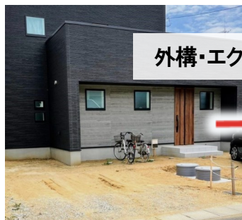
外構・エクステリア工事