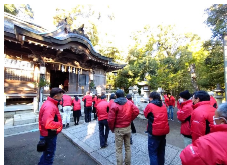
部署を超えて、明るい談笑をしながら新年の挨拶を交わしあう様子があちこちで見られました。