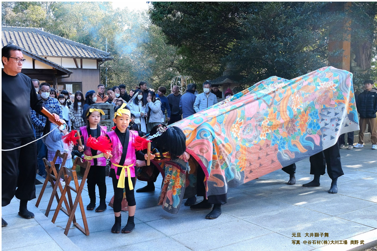
元旦 大井獅子舞

創業以来100余年、幸せな明日へ祈りの心を… NS 中谷石材株式会社 〒761-0121 高松市牟礼町牟礼3766-1 電話 087-845-5006